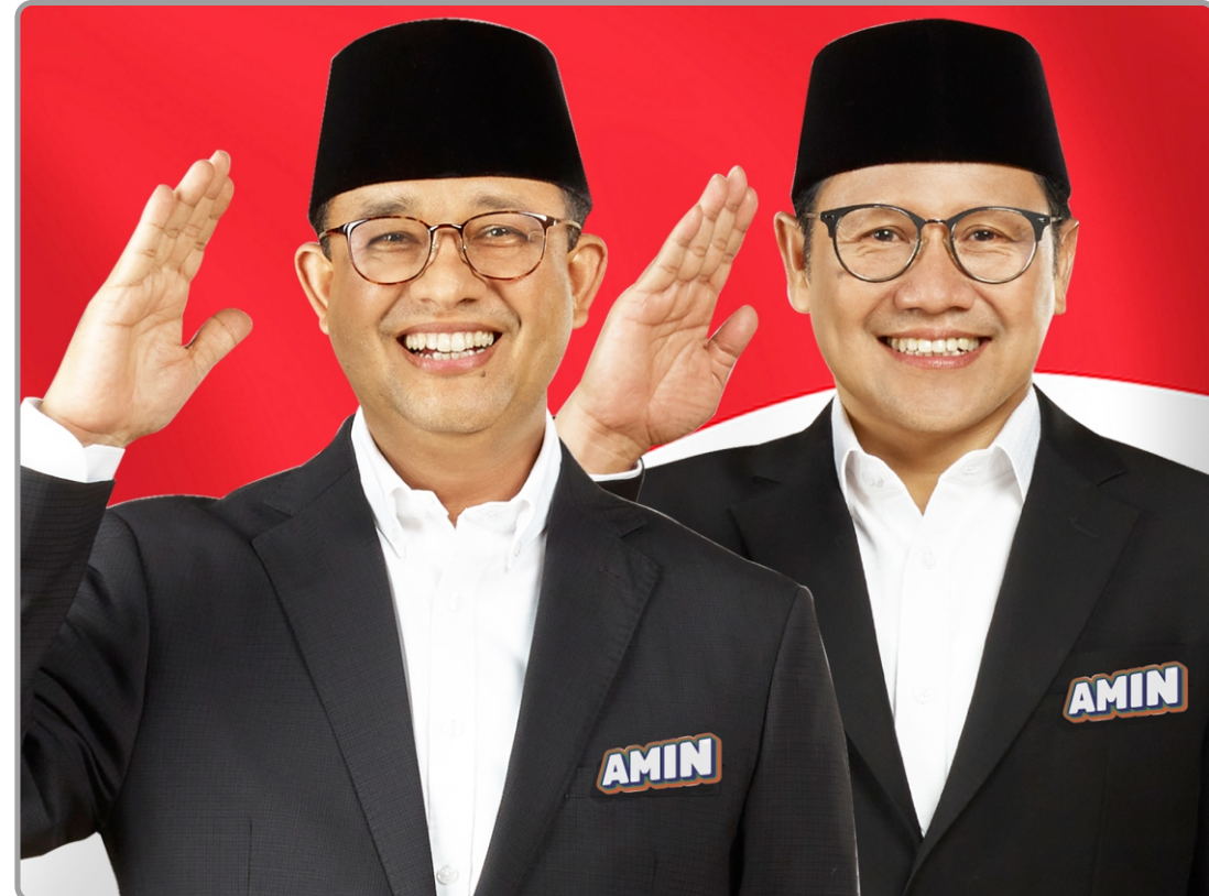
CALON PRESIDEN H. ANIES RASYID BASWEDAN, Ph.D