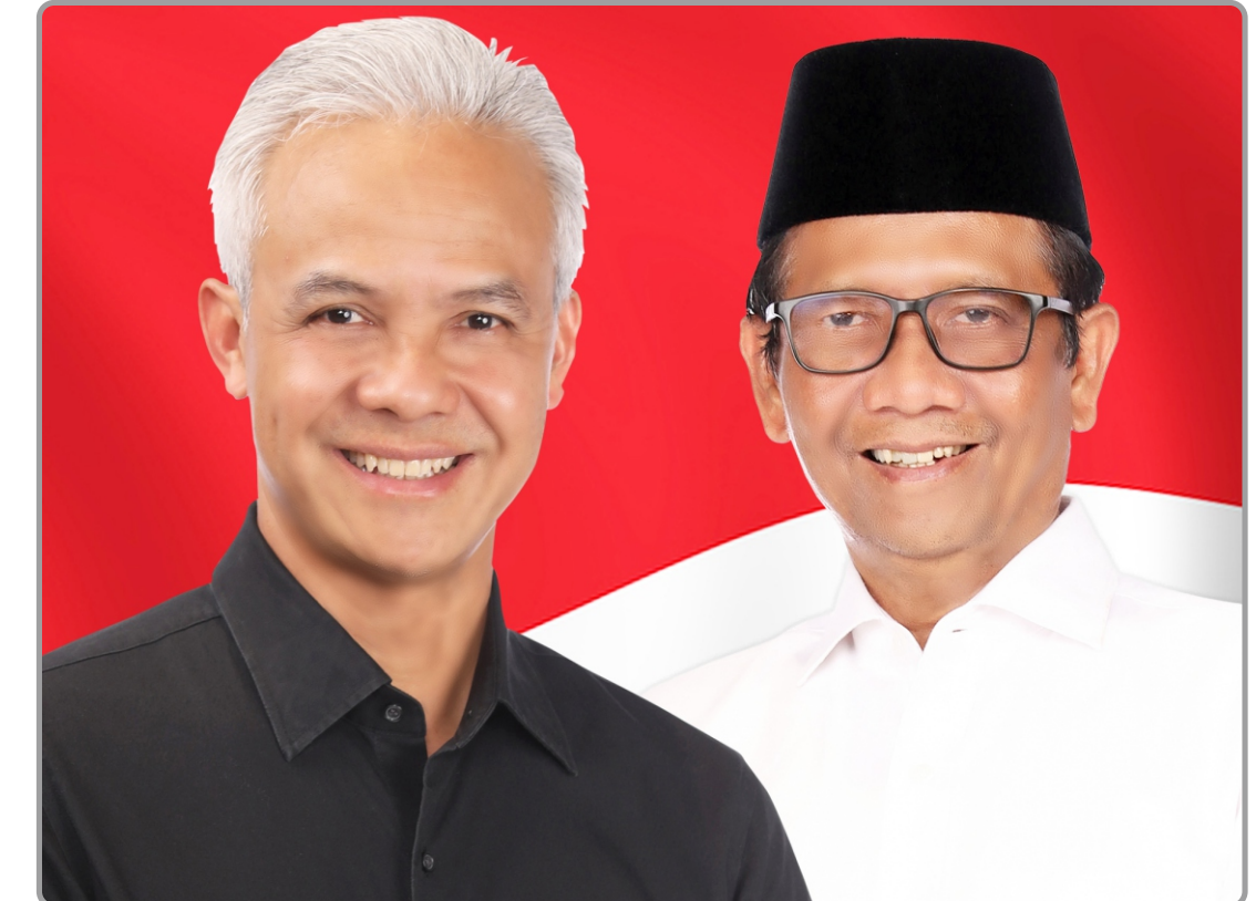
CALON PRESIDEN H. GANJAR PRANOWO, S.H., M.I.P.